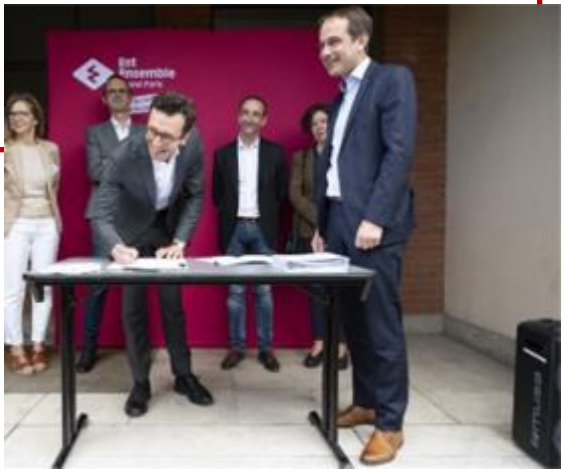
Séance de signature de la Charte - juin 2022

Des documents-cadre opérationnels existants : - Référentiel pour un Aménagement Durable : préconisations méthodologiques en économie circulaire sur les volets matériaux, déchets et sols - Charte EC BTP : engagement de 42 bailleurs, aménageurs et promoteurs sur une méthodologie commune pour intégrer l'économie circulaire dans leurs opérations