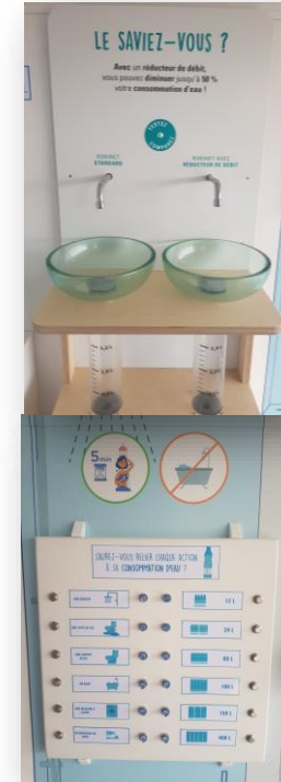
maquettes consommations d'eau