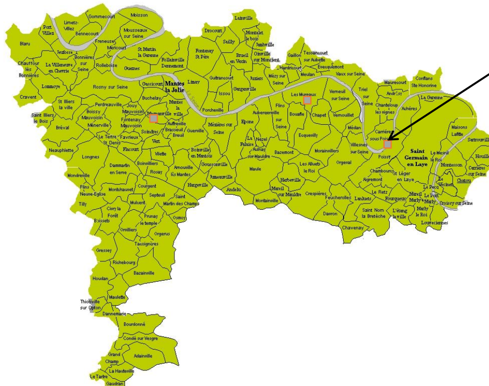
Fabrique 21 CARRIERES-SOUS-POISSY