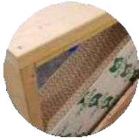
Ossature Carton recyclé (IPAC) Bois