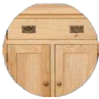
Mobilier Palettes de bois