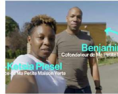
Portrait de MaPetiteMaisonVerte sur France 2 dans Une minute pour s'engager.