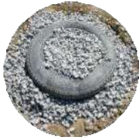
Fondation Pneus gravier