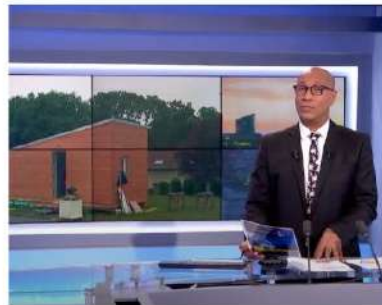
Reportage réalisé par Martinique La 1ère dans le Journal du soir dédié à MaPetiteMaisonVerte.