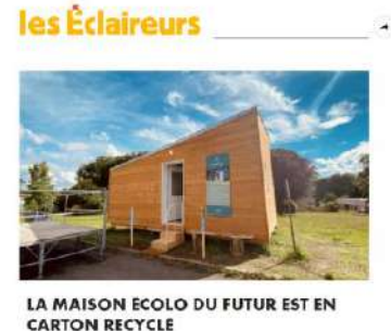
"C'est une jeune entreprise francilienne qui a développé ce concept innovant d'habitat écologique, qu'elle veut aussi solidaire."