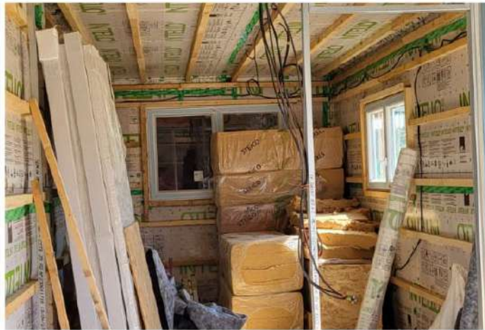
Intérieur maison Charlotte