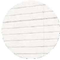
Extérieur Bardage bois