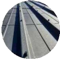
Toiture Fibres de cellulose