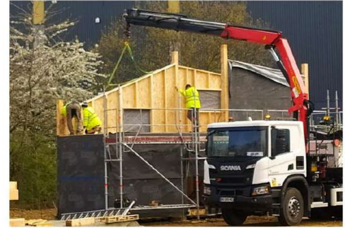
Maison Charlotte à étage, 2 personnes