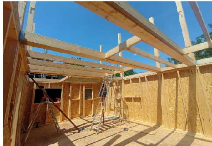
Maison Isaure à étage, 3 personnes