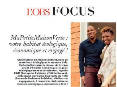
"C'est un duo d'expérience, passionné de construction et qui a l'engagement social et écologique chevillé au corps." (lire l'article en annexe)