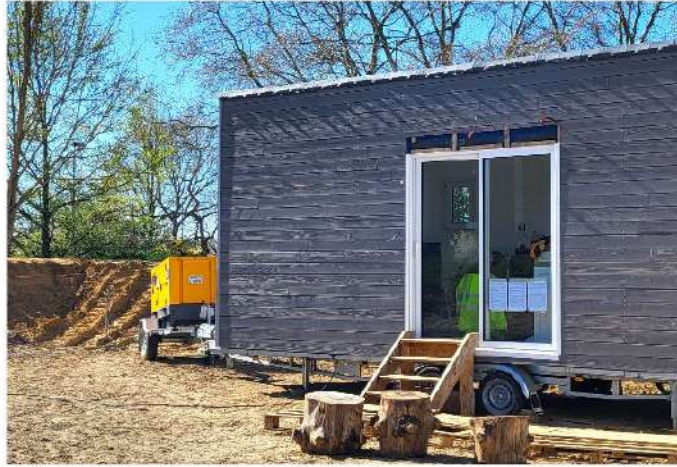
Tiny house Gabriel, 1 personne