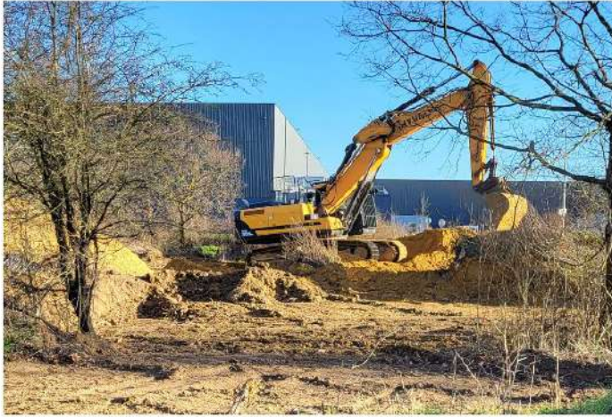
Terrassement du terrain