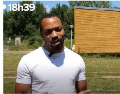
Reportage sur MaPetiteMaisonVerte sur la chaîne Youtube 18h39.fr, le magazine de Castorama.