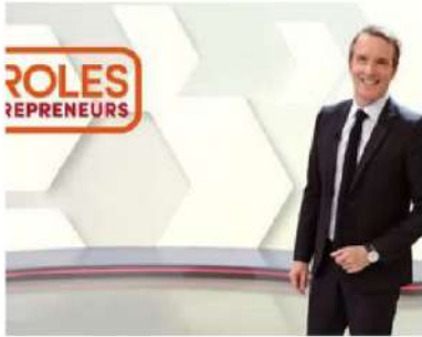
Passage télévisé et portrait de MaPetiteMaisonVerte sur M6 dans l'émission "Paroles d'entrepreneurs".