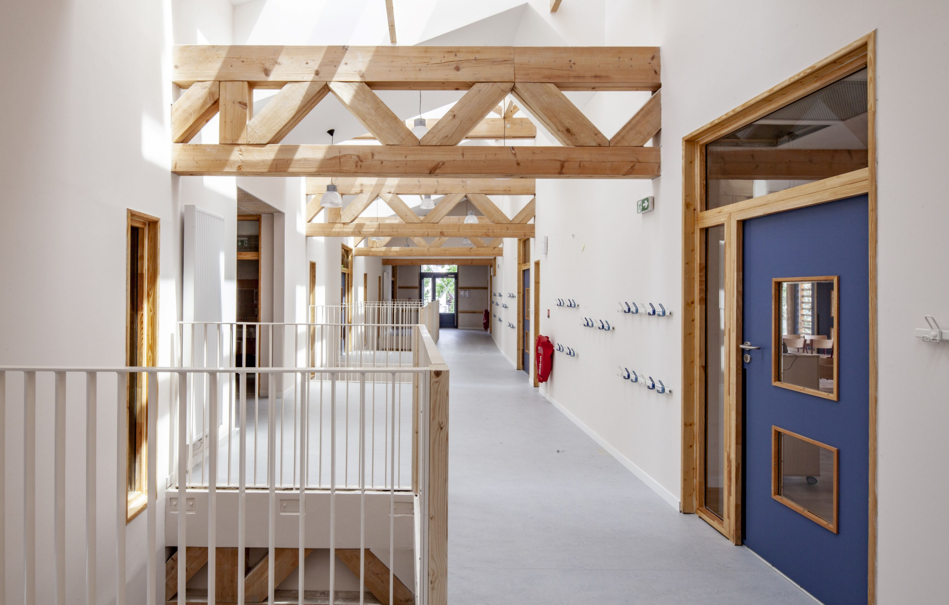
Centre de loisirs Chirac